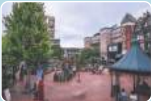
1 白い恋人パーク 最寄り停留所 西町北20丁目