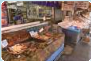
6 札幌市中央卸売市場 最寄り停留所 札幌場外市場