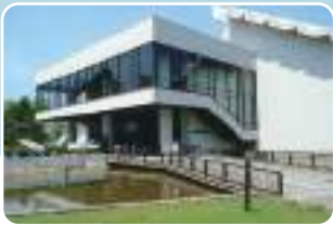
7 道立近代美術館 最寄り停留所 道立近代美術館