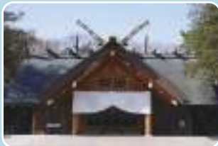
2 北海道神宮 最寄り停留所 北海道神宮