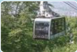
3 藻岩山 最寄り停留所 もいわ山ロープウェイ