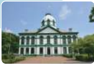
8 開拓の村・北海道博物館 最寄り停留所 開拓の村、北海道博物館