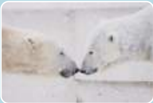
5 円山動物園 最寄り停留所 円山動物園正門