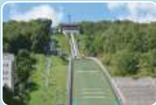
4 大倉山 最寄り停留所 大倉山ジャンプ競技場