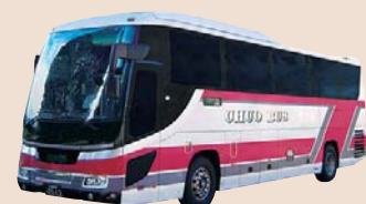
北海道中央バス 空知中央バス