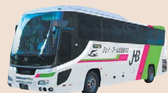
ジェイ・アール北海道バス